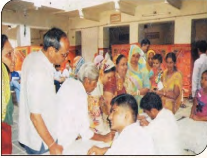
श्रीमाली समाज में आयोजित हैल्थ कैंप।