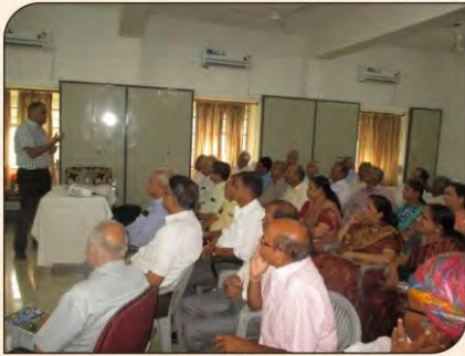
बिजली निगम कर्मचारियों की कार्यशाला में चर्चा करते हुए।