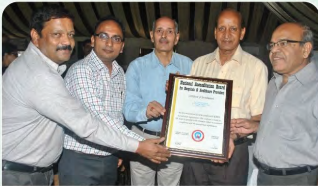
2012 : जीबीएच अमेरिकन हॉस्पिटल प्रबंधन मंडल को स्वच्छता, गुणवत्ता और रोगियों के विश्वास के सभी मानक पूरे करने पर NABH प्रमाण पत्र दिया गया था।