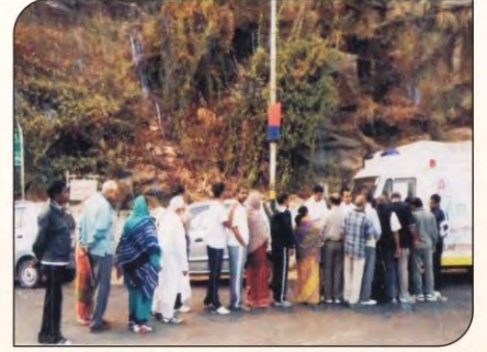
फतहसागर की पाल पर मधुमेह जांच के लिए लगी कतार।