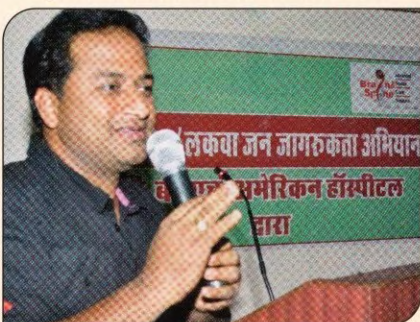
लकवा जन जागरूकता अभियान।