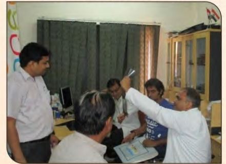
मस्तिष्क रोग जांच शिविर में परामर्श देते हुए।