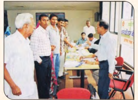
ई.एस.आई. कर्मचारियों के लिए परिसर में आयोजित हैल्थ कैंप।