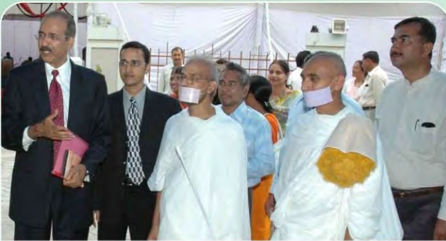
जीबीएच अमेरिकन हॉस्पिटल परिसर में पधारि जैन संतों का अभिवादन करते सीएमडी।