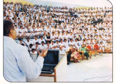
दिल्ली पब्लिक स्कूल में हैल्थ अवेयरनेस पर व्याख्यान देते डॉक्टर।