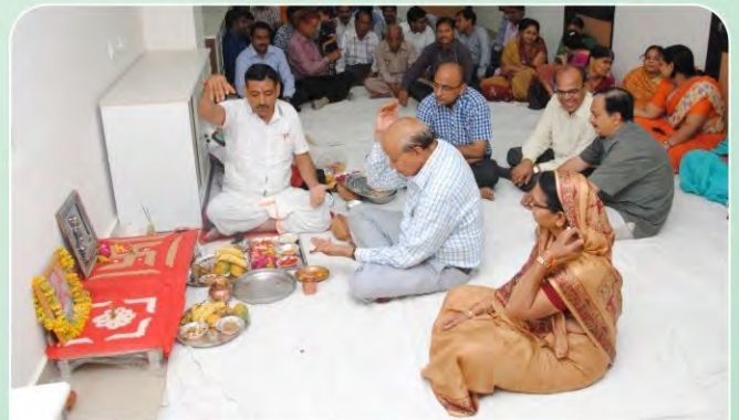
जीबीएच मेमोरियल कैंसर हॉस्पिटल के औपचारिक उद्घाटन समारोह में मौजूद स्टाफ