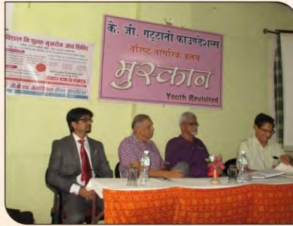
मुस्कान क्लब में कैंसर जागरूकता पर वार्ता।