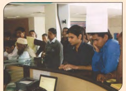
जीबीएच में निशुल्क जांच शिविर में लगी कतार।