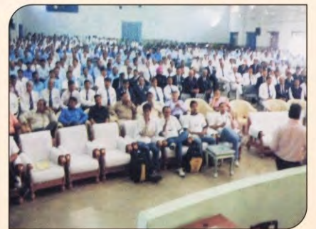
रेलवे ट्रेनिंग स्कूल स्टाफ को तनाव मुक्ति के फायदे बताते डॉक्टर।