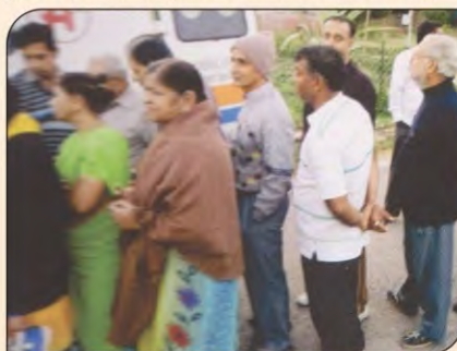
गुलाबबाग में स्वास्थ्य जांच कराने लगी कतार।