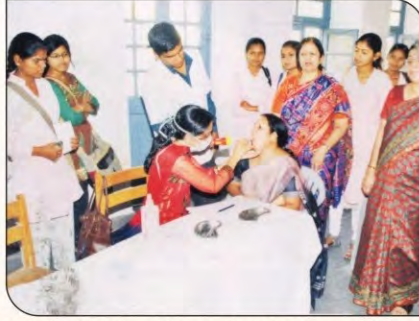
एम.जी.कॉलेज में आयोजित दंत रोग जांच एवं परामर्श शिविर।