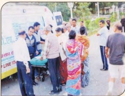
गुलाबबाग में मीनिंग वाकर्स की स्वास्थ्य जांच करता स्टाफ