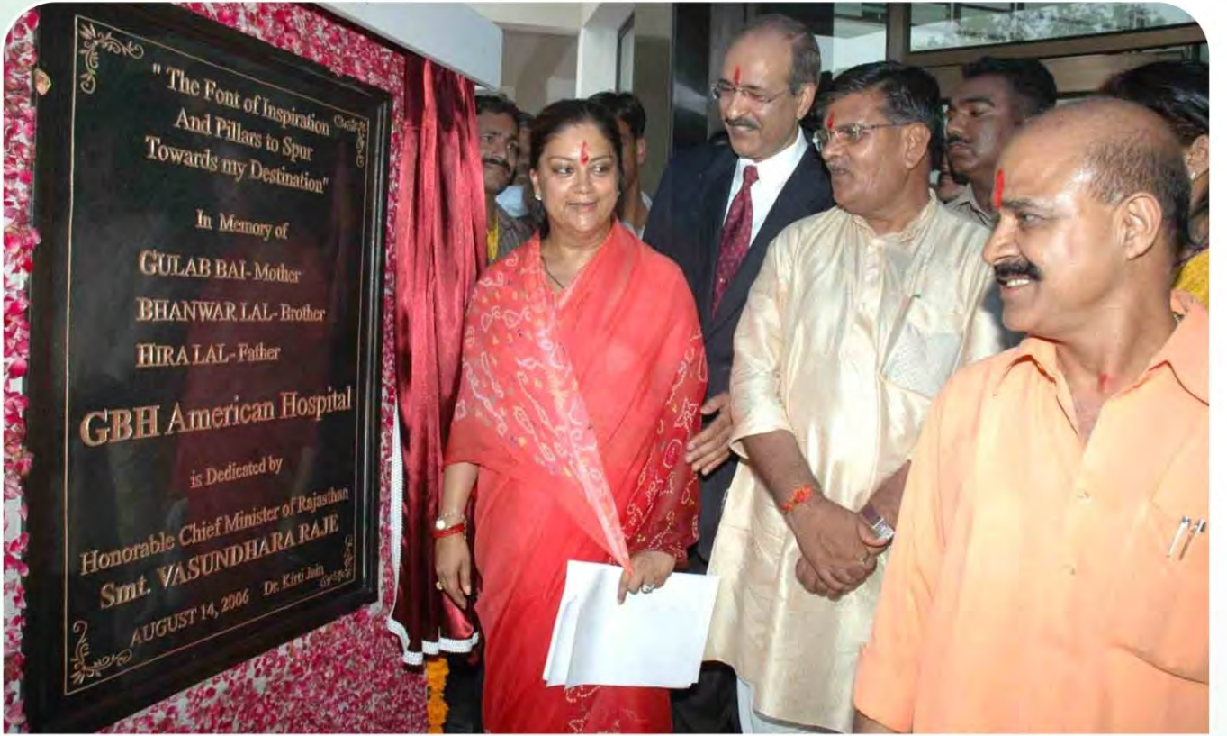
14 अगस्त 2006 : जीबीएच अमेरिकन हॉस्पिटल का उद्घाटन करते मुख्यमंत्री वसुंधरा राजे। साथ में मौजूद है तत्कालीन मंत्री गुलाबचंद कटारिया और भवानी जोशी।