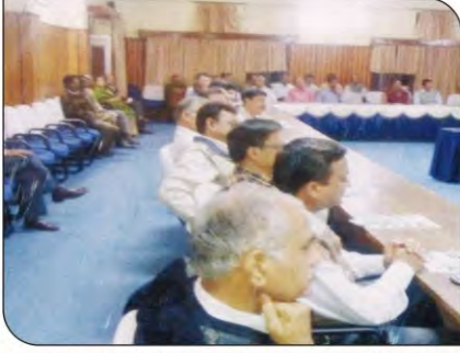
सीटीएई कॉलेज में हैल्थ अवेयरनेस पर व्याख्यान देते डॉक्टर।