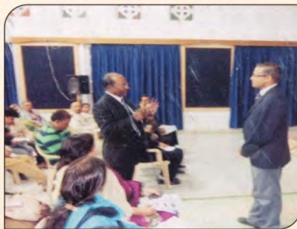
इंडियन सोसायटी फॉर ट्रेनिंग एंड डवलपमेंट के साथ कार्यशाला।