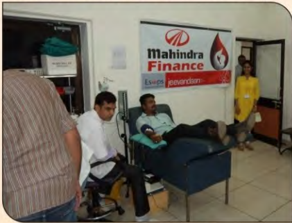
महेन्द्रा फायनेंस की ओर से जीबीएच हॉस्पिटल में रक्तदान।