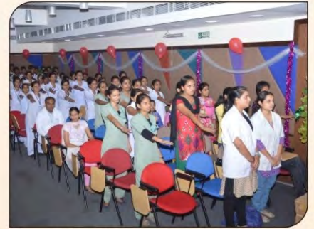
जीबीएच में नर्सिंग दिवस पर शपथ लेता स्टाफ।