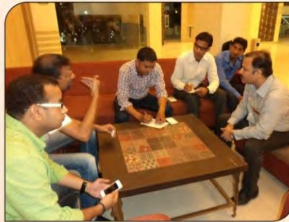
भीलवाड़ा में दन्त चिकित्सकों के साथ मुख कैंसर पर चर्चा।