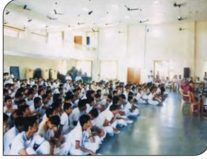
सेंट ग्रेगोरियस स्कूल में हैल्थ अवेयरनेस पर व्याख्यान देते डॉक्टर।