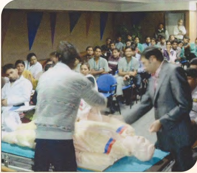
स्टाफ को हार्ट अटैक के समय सी.पी.आर. (Cardio Pulmonary Resuscitation) का प्रशिक्षण देते डॉक्टरों।

जीबीएच अमेरिकन हॉस्पिटल के डॉक्टरों के अलावा सप्ताह में एक दिन लोगों के बीच उनके शहर में भी पहुंच रहे हैं। पिछले दस साल से यह क्रम निरंतर बना हुआ है। अन्य शहर में पहुंचकर यहां के डॉक्टरों की सेवाओं पर गौर करें तो . . . .