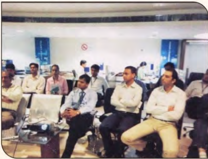
यस बैंक कर्मचारियों को तनाव मुक्त रहने का प्रशिक्षण देते हुए।