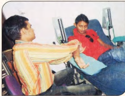
'कोशिश' के स्वयं सेवक रक्तदान करते हुए।